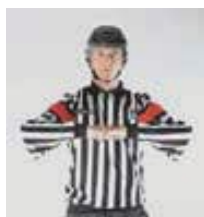
Donner de la bande