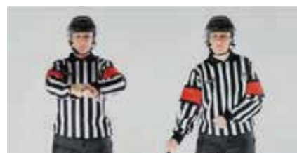
Retenir le bâton