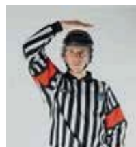
Pénalité de match