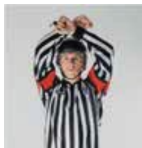
Tir de pénalité