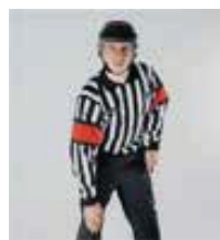
Coup de genou