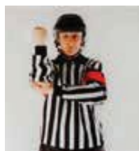
Coup de coude