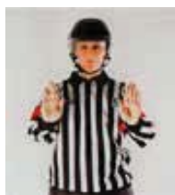
Charge par derrière