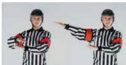
Retard de jeu